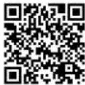
地域みらい留学 那賀高校HP