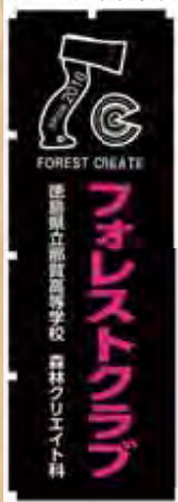
フォレストクラブ