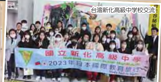
台湾新化高級中学校交流